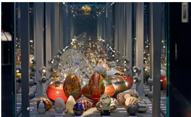
Wertvolle Eier in der Schatzkammer