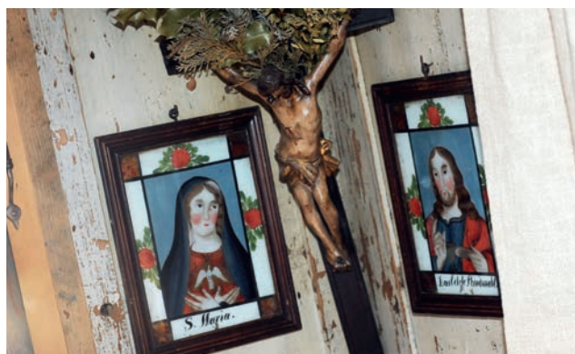
Herrgottswinkel im Bäuerlichen Wohnmuseum