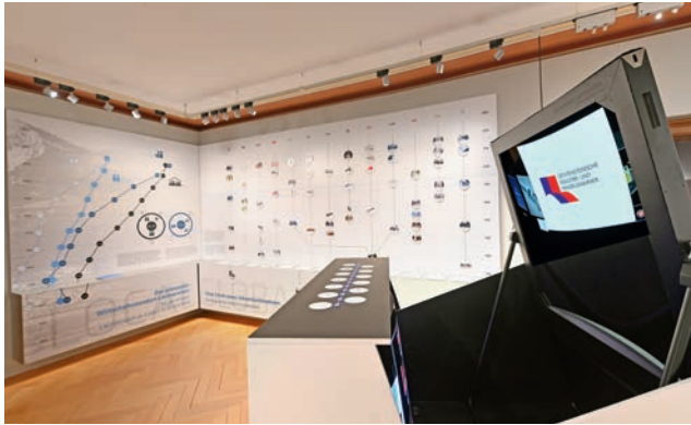
Die neue IndustrieWelt Liechtenstein im Landesmuseum