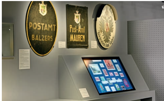
Touchscreen des digitalen Briefmarkenkatalogs im Postmuseum